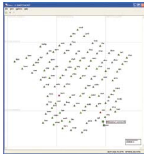
La partie réservée aux utilisateurs du site de TERIA propose un suivi en direct de l'état des stations. Vert : service normal ; orange : service dégradé ; rouge : communications interrompues.

un symbole coloré : vert : OK ; jaune : problème ; rouge : lien rompu (cette cartographie, ainsi que des paramètres techniques poussés, sont accessibles aux utilisateurs sur le site Internet http://www.reseau-TERIA.com ). TERIA est suffisamment redondant pour accepter une rupture