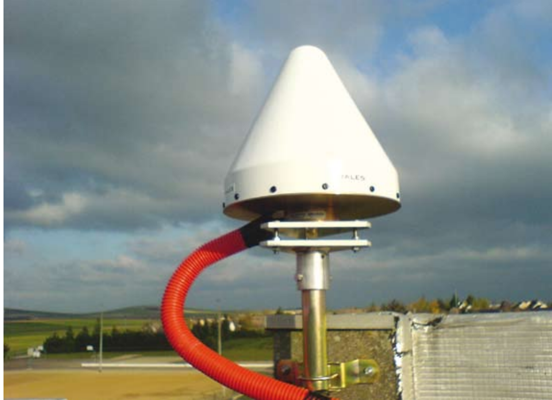
Exemple d'installation d'une antenne GPS TERIA : bâtiment de faible taille, terrasse, ciel dégagé sur 360°.

La principale difficulté que nous avons rencontrée a été de finaliser certaines conventions avec des collectivités locales ou des établissements publics comme ceux de l'Éducation nationale : il fallait plusieurs mois pour obtenir des agréments de la part de commissions qui exigeaient des accords préliminaires d'autres commissions, et ainsi de suite, si bien que, dans certains cas, nous avons dû âprement négocier un an avant d'avoir le feu vert. La psychose vis-à-vis des antennes GSM a joué, même lorsque nous expliquions qu'il s'agissait uniquement d'antennes de réception. De surcroît, nous sommes tombés pendant la période électorale, certaines communes ont changé de maires, parfois des autorisations signées nous ont été retirées. En revanche, certaines régions nous ont réservé un accueil enthousiaste – preuve en est que quelques stations sont posées sur les bâtiments de la DGI ! Finalement, nous enregistrons environ un an et demi de retard sur le prévisionnel, mais