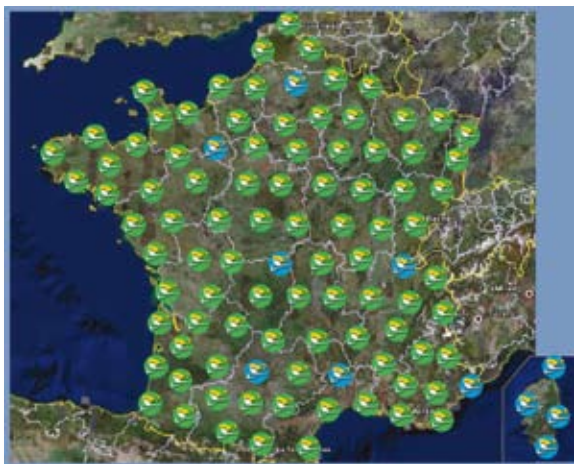
Déploiement du réseau TERIA en septembre 2008.

TERIA est ouvert à tous, y compris aux non-géomètres-experts : la DGI, par exemple, l'utilise