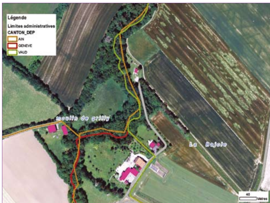
Les différentes sources de données ne sont pas d'accord sur le tracé exact de la frontière.

et la valeur juridique du cadastre par des attributs mais cela ne suffira pas. C'est pourquoi les métadonnées devront être claires et précises, limitant au maximum les confusions de la part des utilisateurs.