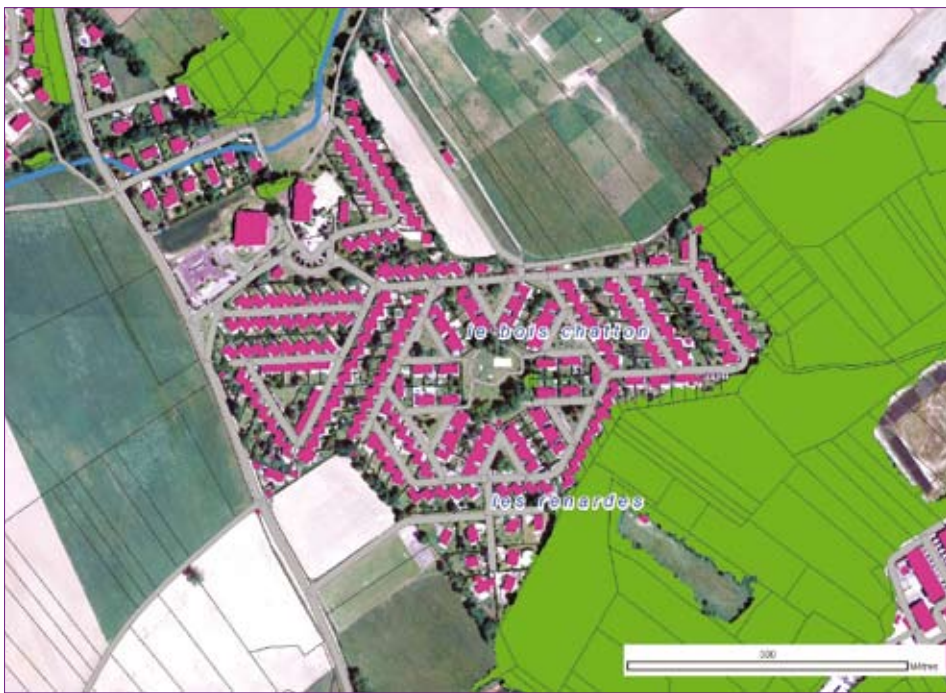
Exemple d'exploitation (visualisation) des futures données du socle.