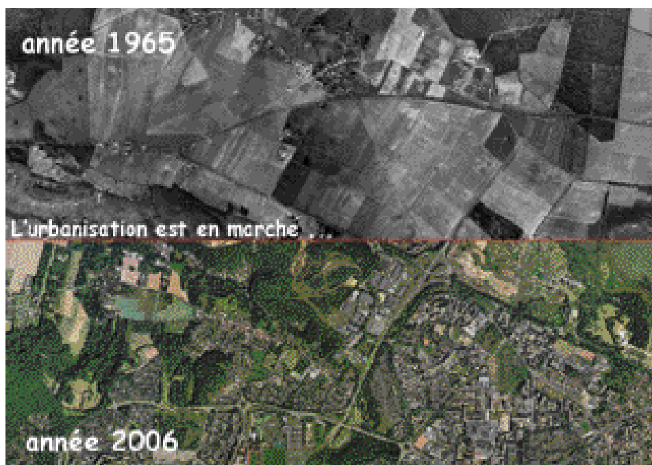
Sur cette image d'une zone mitoyenne à Trappes et à Élancourt, on mesure le changement paysager et urbain accompli en quarante ans. On distingue en bas à gauche le parc France miniature.

À l'origine, les mises à jour se faisaient sur un rythme trimestriel. Malheureusement, les incohérences (dues à des mises à jour décalées) entre les bases du bâti, les données graphiques et Majic, trop lourdes à gérer, ont conduit l'équipe SIG à abandonner cette cadence en faveur d'un renouvellement annuel. À l'heure actuelle, il existe donc deux référentiels « sol » : le cadastre et le foncier, actualisé en propre grâce à l'inté-