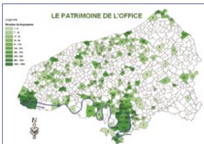
Le patrimoine de l'OPAC comprend des implantations urbaines autour de Rouen et du Havre, mais également un grand nombre de bâtiments en zone rurale.

l'établissement de connaître l'intégralité du patrimoine immobilier. D'où l'idée d'optimiser la gestion de l'information géographique, jusque là disséminée dans des bases de données Oracle (accessibles via un progiciel qui nécessite une formation lourde), à l'aide d'un SIG. Un choix d'autant plus pertinent que l'OPAC désirait